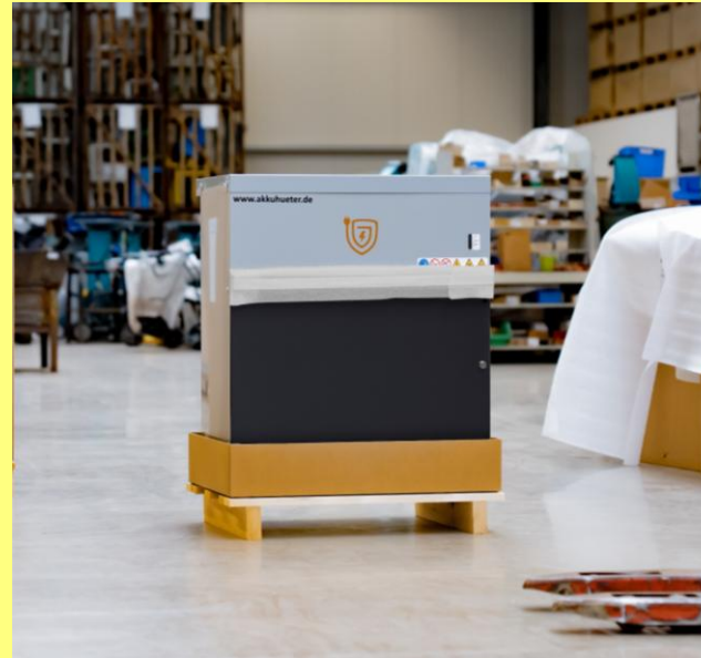
Standardfarbe FS1 anthrazit/ fenstergrau